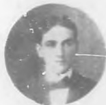
Por Julio César Gandarilla.—Habana.

¿CÓMO pudieran anatematizarse en nombre de la patria estos extraviados—quizás necios—esfuercos nobilmente enervados hacia su servicio y exaltación?